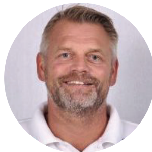
BENTDAHL Lector EHF