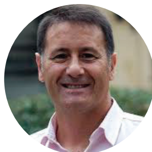
FORT MAURI JAUME Antrenor portari România